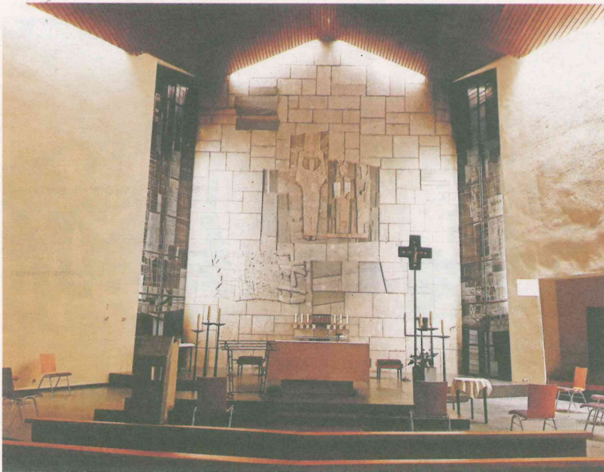
Innenansicht mit Beleuchtung der Rückwand des Altarraumes.