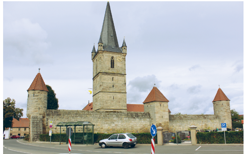
Außenansicht der renovierten Wehrkirche.