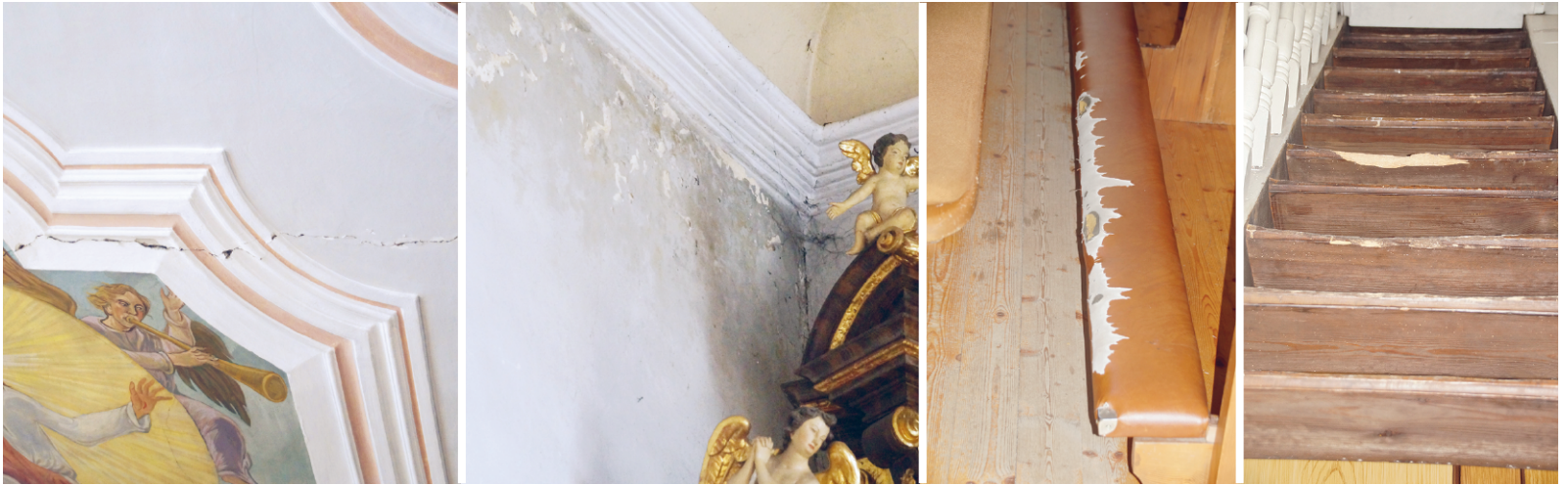
Die Bilder zeigen eine Auswahl der Schäden die fachgerecht beseitigt wurden.